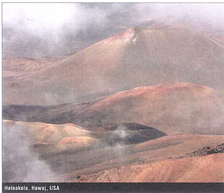
Haleakala, Hawaj, USA

stínů černé, technicky se mu říká sRGB. Problém nastane ve chvíli, kdy takto pořízený snímek chcete vytisknout – ať už doma na fototiskárně nebo v minilabu chemickou cestou. Při tisku dochází ke konverzi původního barevného prostoru na barevný prostor používaný tiskovým zařízením (obvykle je to CMYK) a ačkoliv se jedná o doplňkové barvy, tak převod není stoprocentní. Nejobtížnější je situace u ofsetového tisku – tam je úbytek barev (jemné tonální přechody) a především dynamiky (hloubka černých odstínů) nejvíce viditelný.