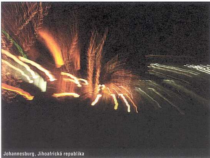
Johannesburg, Jihoafrická republika