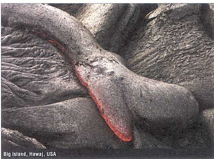
Big Island, Hawaj, USA